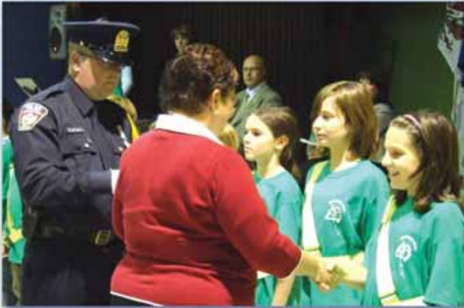
Lors de l'assermentation des jeunes brigadiers, l'émotion était palpable... Quelle belle façon de les responsabiliser !