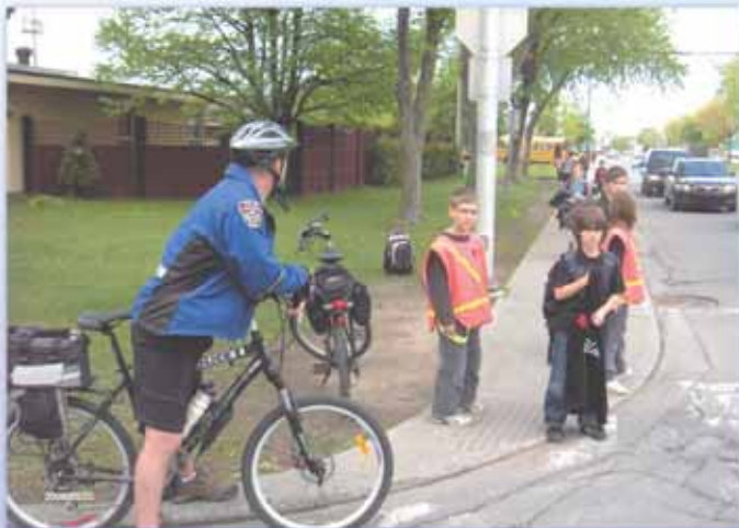
L'implication des policiers dans la communauté a permis d'augmenter leur sentiment d'appartenance. Ici, un policier à vélo s'entretient avec des jeunes de l'école Saint-Marc.