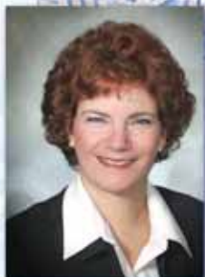
Thérèse Gatin District La Promenade

Les lundis 19 janvier, 16 février et 16 mars 2009 : 19 h séance ordinaire