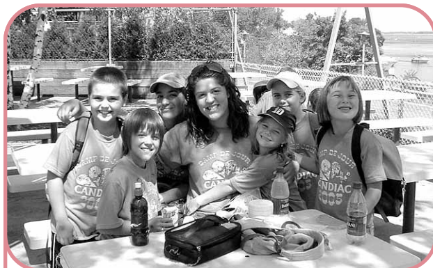
A tous les mercredis, cap sur une activité extérieure ! Ici, on s'amuse à la Ronde.

Aussi, afin de favoriser dès leur arrivée la fréquentation de leur bibliothèque municipale, les nouveaux arrivants reçoivent un abonnement familial gratuit pour la première année. Et de concert avec les Bibliothèques publiques du Québec , Candiatic participe au programme Une naissance, un livre .