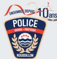
RÉGIE INTERMUNICIPALE DE POLICE ROUSSILLON

Déjà 10 ans pour la Régie intermunicipale de police Roussillon. C'est en effet en 1999 que se regroupaient les corps policiers des villes de Candiac, Delson/St-Constant et Ste-Catherine suivies, quelques années plus tard, par La Prairie, St-Mathieu et St-Philippe. Aujourd'hui, la Régie regroupe 110 policiers et 40 civils, pour desservir près de 93 000 individus. En 2009, à l'occasion de son dixième anniversaire de fondation, la Régie s'est dotée d'un tout nouveau logo, lequel représente fidèlement les principaux éléments définissant la profession de policier.